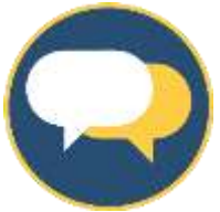
Figura con el Logo