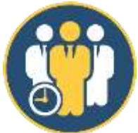
Figura con el nombre