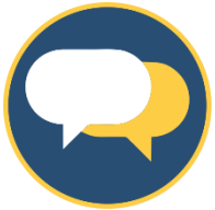
Figura con el Logo